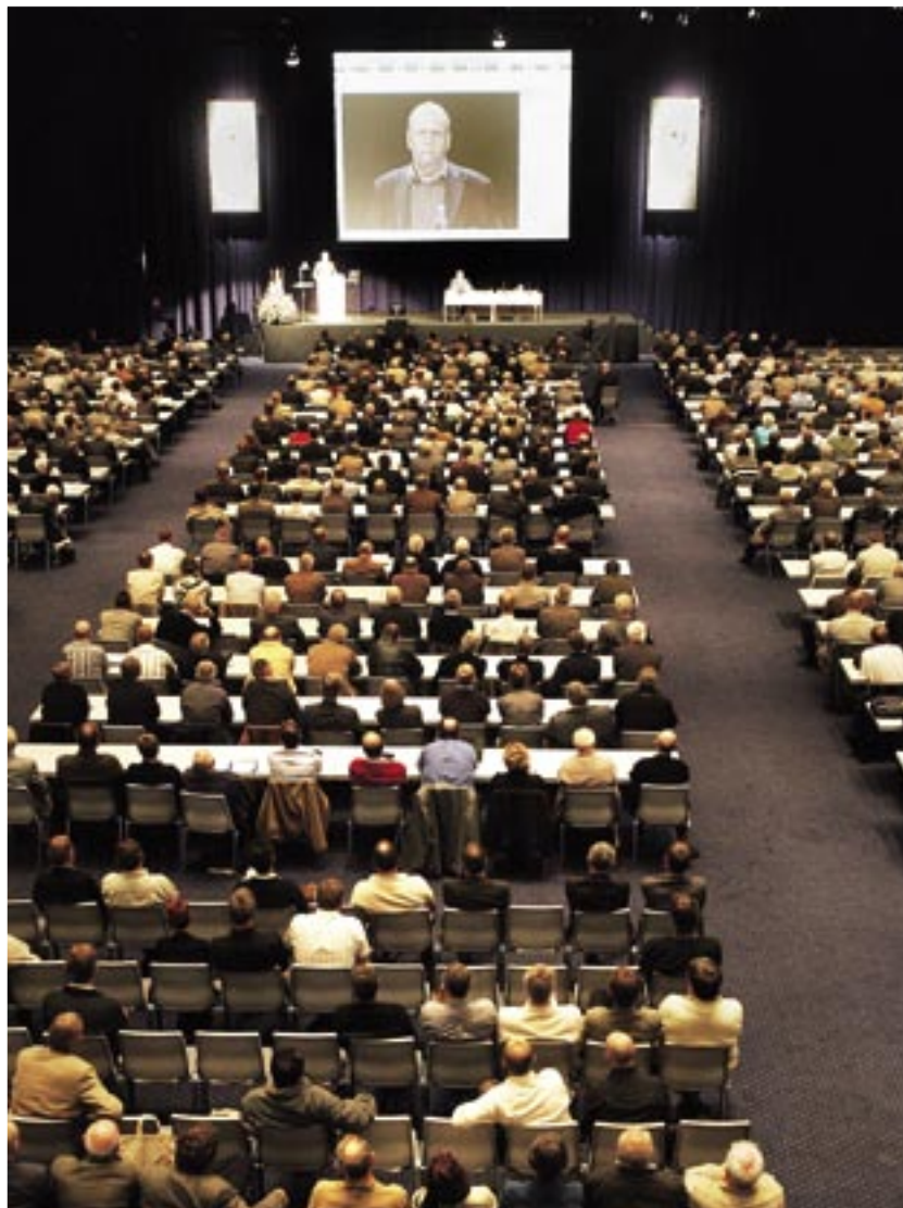
Dansk Fjernvarmes landsmøde er årets begivenhed i fjernvarmebranchen. Mødet har hvert år cirka 1.500 deltagere.

Temadage arrangeres løbende, når der opstår behov for en indgående behandling af aktuelle emner.