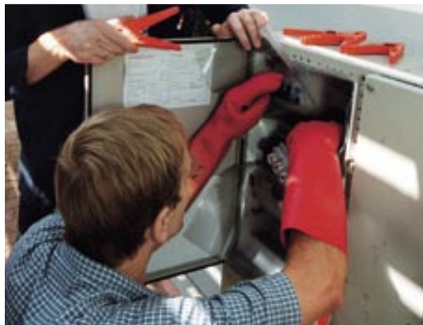
Dansk Fjernvarmes kurser er med til at sikre, at fjernvarmesektoren fortsat har et godt image via kompetente og kvalificerede medarbejdere. 900 personer deltager årligt i foreningens kurser.

Erfaringsgrupperne er dynamiske størrelser, der tilpasser sig det aktuelle behov. Nye grupper opstår og andre nedlægges, når deres formål er opfyldt. Derfor er erfaringsgrupperne et godt udtryk for en af Dansk Fjernvarmes vigtigste funktioner: At organisere erfaringsudvekslingen på tværs af branchen.