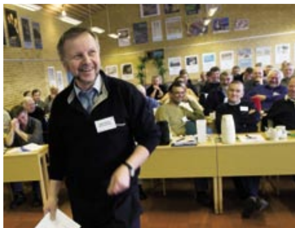
Regionalmøderne er en årlig mødeturné, hvor Dansk Fjernvarme er vært ved en række møder landet over. Møderne er med til at sætte aktuelle politiske og tekniske emner på dagsordenen.