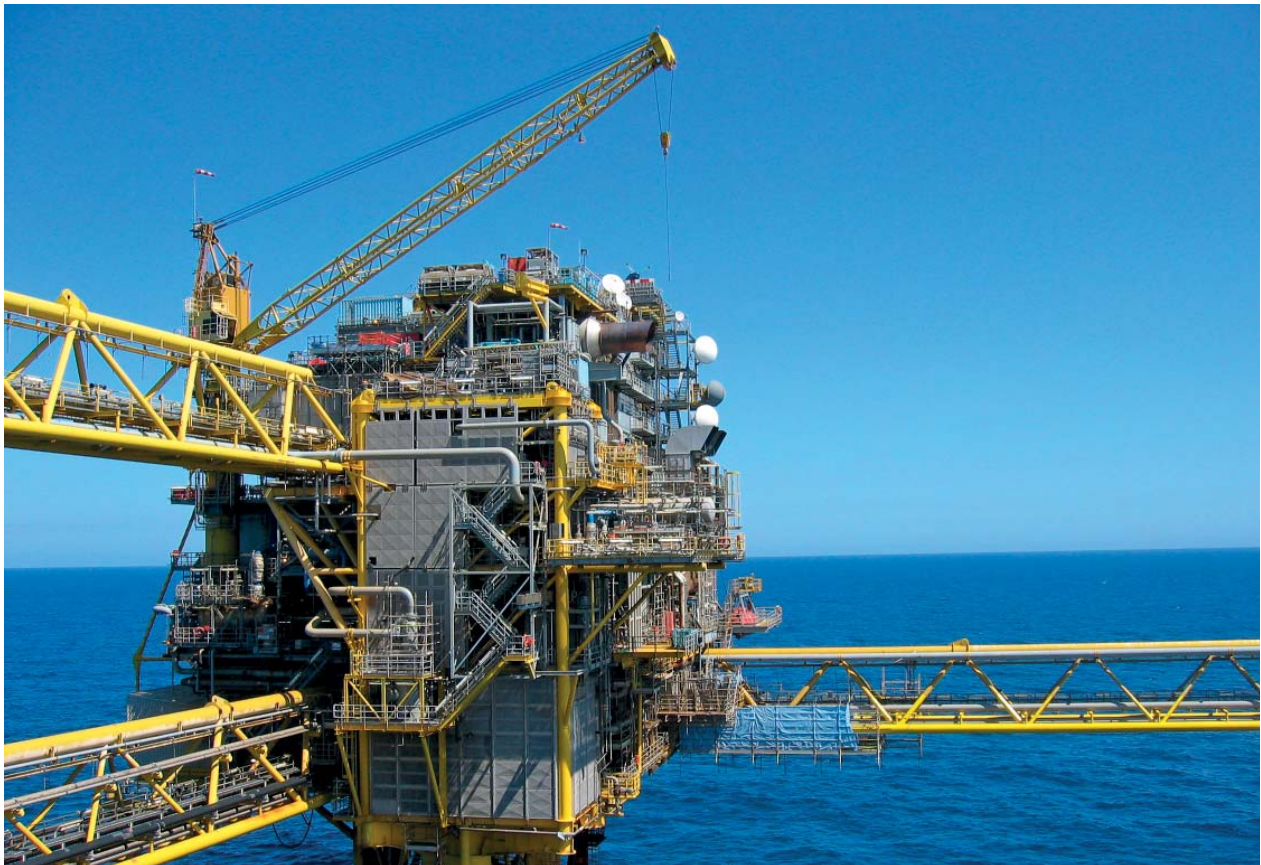
Siden starten af 80'erne har Danmark hentet sin egen naturgas ind fra Nordsøen. Naturgassen er det mindst miljøbelastende fossile brændsel, som det ville være naturligt at bruge, indtil vi kan frigøre os helt fra fossile brændsler. Men sådan ser det pt. ikke ud til at gå.

hverdage i dagtid på grund af højere elpris. Derfor blev der samtidig installeret lagertanke til at gemme varmen i til forbrug om natten og i weekender.